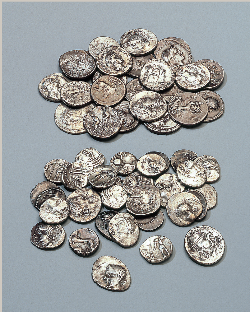
Fig. 151 Belp BE, Belpberg, Hofmatt. Une partie du trésor constitué de quinaires gaulois et de deniers de la République romaine.

En l'état actuel des recherches, les quinaires gaulois du trésor n'ont pas été frappés sur le territoire suisse, mais français. Ils portent presque tous des noms d'aristocrates gaulois, probablement en charge des frappes monétaires, et par ailleurs souvent connus par les sources antiques : par exemple Vepotal ( Fig. 153 ), Togirix, Solima, Lucios, et Orgetirix. Ces pièces sont principalement recueillies