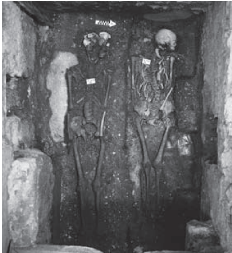
Abb. 1 Die Gräber 47 A und 46 A (rechts)

Das Ensemble befindet sich in einem Plastiksäckchen beim linken Oberschenkel des rechten Skelettes.