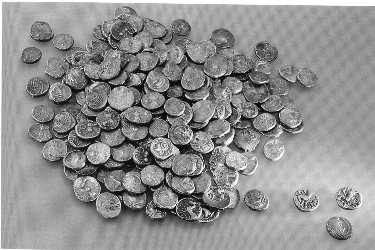
Abb. 11. Füllinsdorf BL, Büechlihau-Nord. Spätlatènezeitlicher Hort mit 298 Münzen, meist Kaletedou-Quinaren.

sont probablement attribuables à cette phase. Mais la principale structure est une tombe à incinération. Cet aménagement était bien délimité par un couronnement de pierres calcaires. De forme rectangulaire, ses dimensions suggéraient initialement une inhumation, mais les seuls restes osseux recueillis dans la structure résultent d'une incinération. La tombe a en outre livré un mobilier funéraire constitué d'un pot et d'un bol en céramique, de deux épingles et d'une lame de poignard en bronze.