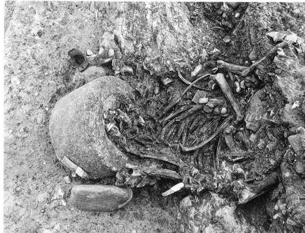
Fig. 13. La Sarraz/Eclépens VD, Le Mormont. Fosse 634. Dépôt composé d'une meule et des restes fauniques.