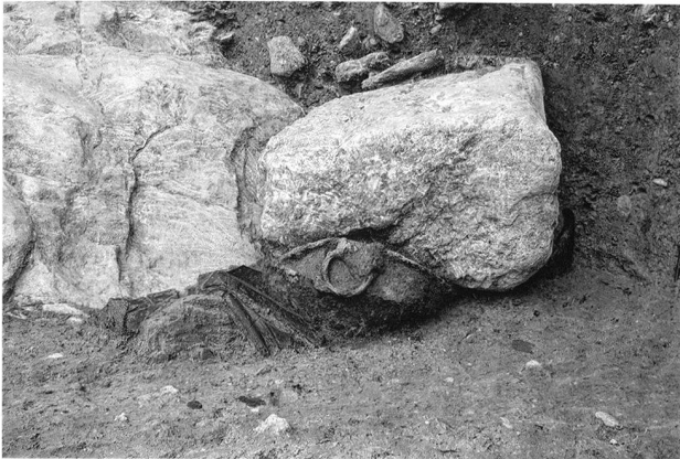
Fig. 12. La Sarraz/Eclépens VD, Le Mormont. Fosse 642. Dépôt au fond de la fosse composé d'un chaudron en fer, de deux vases en céramique et de quelques ossements animaux.