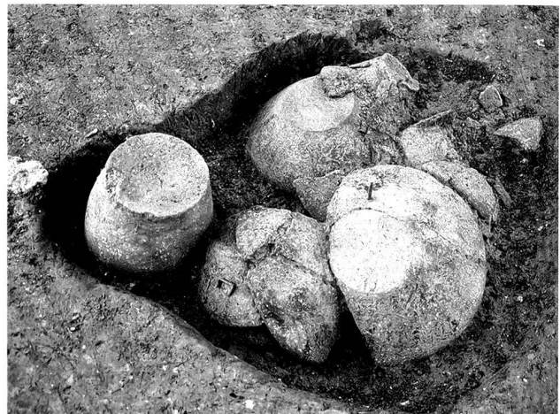
Fig. 10. Chevenez JU, Au Breuille II. Dépôt de pots et jattes empilés dans une fosse, daté du La Tène final.